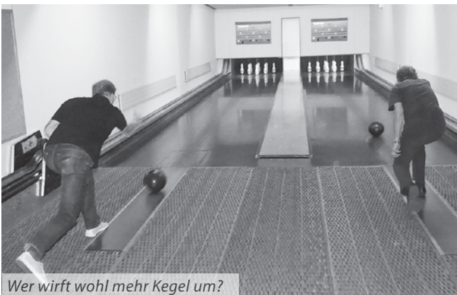
Wer wirft wohl mehr Kegel um?

Um 23.00 Uhr ist Schluss mit Kegeln, auch schon den Anwohnern zuliebe, denn das Umfallen der maximal neun Kegel rumpelt doch zünftig, so dass es in der sonst stillen Nacht weit herum zu hören ist. Nachdem alle ihre Konsumationen bezahlt haben, und der Vereinskassier zusätzlich die Kegelbahnggebühr begli-