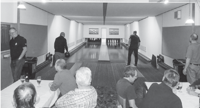
Die Spieler beobachten sich gegenseitig genau, und kommentieren jeden Wurf.

chen hat, sagt man sich gegenseitig Tschüss und verkriecht sich für die Heimfahrt wieder in die drei Autos. Sind sie geschrumpft, oder hat man durch das viele Kugeln schieben muskulösere Oberkörper erhalten? Oder ist doch das feine Abendessen schuld, dass es jene auf der engen Rückbank dünkt, es sei enger geworden im Auto? Aber auch die Rückfahrt nach Hettlingen dauert nicht lange, innert einer Viertelstunde sind die 15 Kilometer zurückgelegt. Aber ob alle sogleich den direkten Weg nach Hause eingeschlagen oder noch einen Umweg via einen Schlummerbecher gemacht haben, das sei nicht verraten.