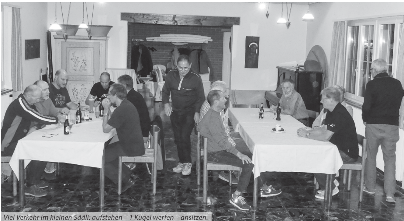
Viel Verkehr im kleinen Säali: aufstehen – 1 Kugel werfen – ansitzen.